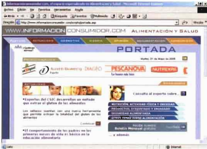
Consumo y Salud