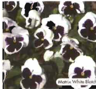
Matrix White Blotch