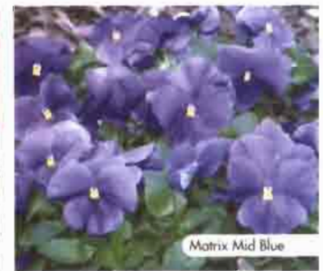
Matrix Mid Blue

Amplia gama de goteros turbulentos y autocompensantes para riego superficial y subterráneo