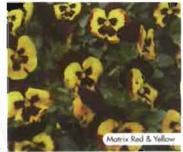
Matrix Red & Yellow