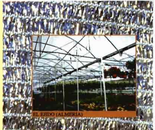
EL EJIDO (ALMERIA)