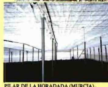
PILAR DE LA HORADADA (MURCIA)