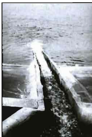
Embalse para el almacenamiento de agua de riego procedente de pozos

Los síntomas foliares en el sodio consisten en necrosis o quemaduras que se inician a lo largo del borde de las hojas más viejas, y se extienden a las zonas intervenales al aumentar la concentración de sodio. El sodio puede alterar el balance nutritivo de la planta causando deficiencia relativa de calcio, potasio o magnesio. El nivel crítico