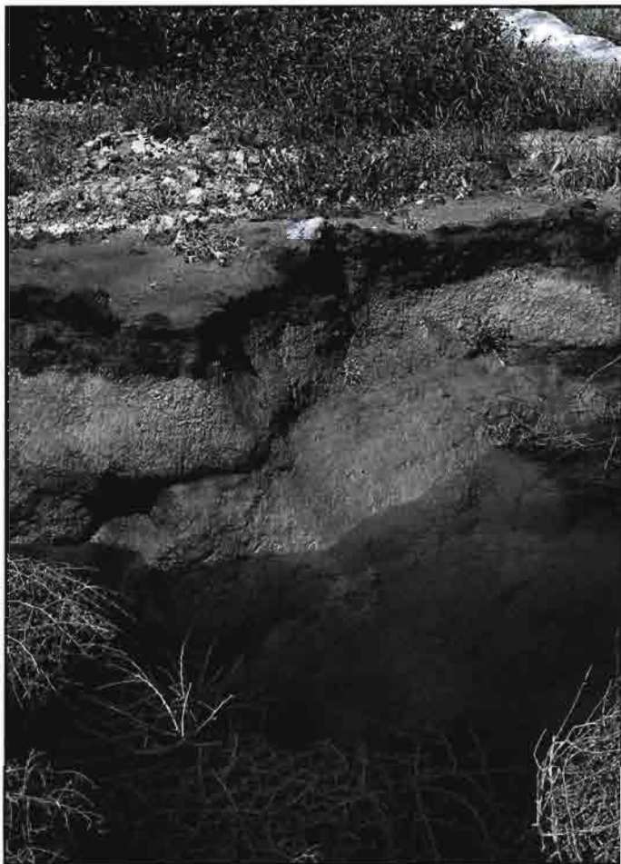
Acumulación de drenajes de procedencia agrícola

dad de los agregados, están directamente relacionadas con el tipo de iones intercambiables. Así, los iones divalentes, y en particular el calcio proporcionan características físicas favorables a los suelos, mientras que el sodio adsorbido determina la dispersión e hinchamiento de las arcillas, llegando, cuando su proporción es suficientemente elevada, a causar la dispersión y la reducción de la permeabilidad de los suelos.