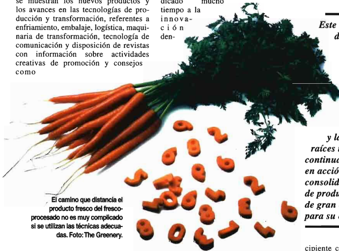
El camino que distancia el producto fresco del fresco-procesado no es muy complicado si se utilizan las técnicas adecuadas.

La empresa dispone de grandes estructuras para el almacenamiento y la transformación de la zanahoria, y ha dedicado mucho tiempo a la innovación.