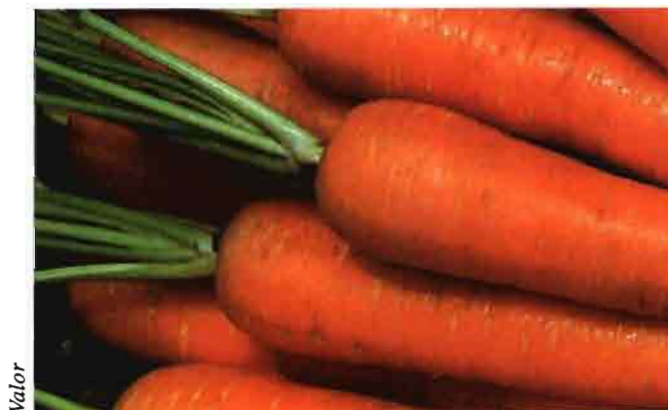
Cuadro 1: Producción en la UE

El abanico de variedades cultivadas de zanahoria está constantemente en au-