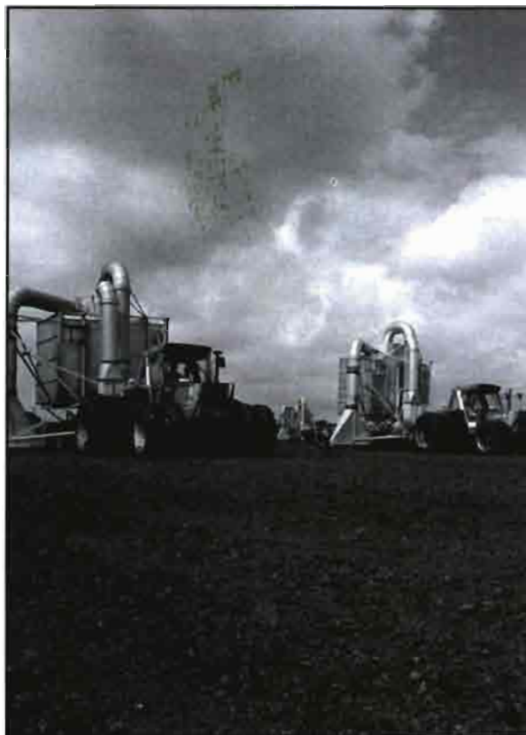
Trabajos de aspiración en una turbera.

La densidad aparente seca también se encuentra en valores tabulados. Por ejemplo, tenemos que la densidad del sustrato hortícola deberá ser de valores comprendidos entre 0,08 a 0,04,