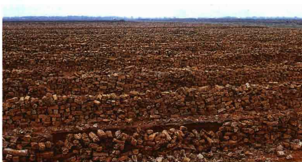
Montserrat Llorba Elena Baró

Determinar las características de los sustratos es fundamental de cara a obtener los rendimientos óptimos en los cultivos