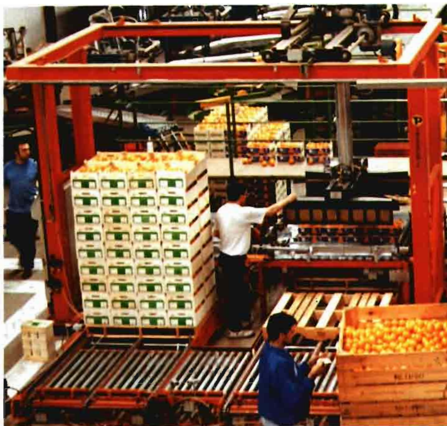
Vista interior de un almacén de confección de cítricos durante una jornada laboral.

carneuba, pues se aduce que pueden producir manchas si los frutos se han desverdizado. En general, las ceras que se usa son las que dan mejores resultados.