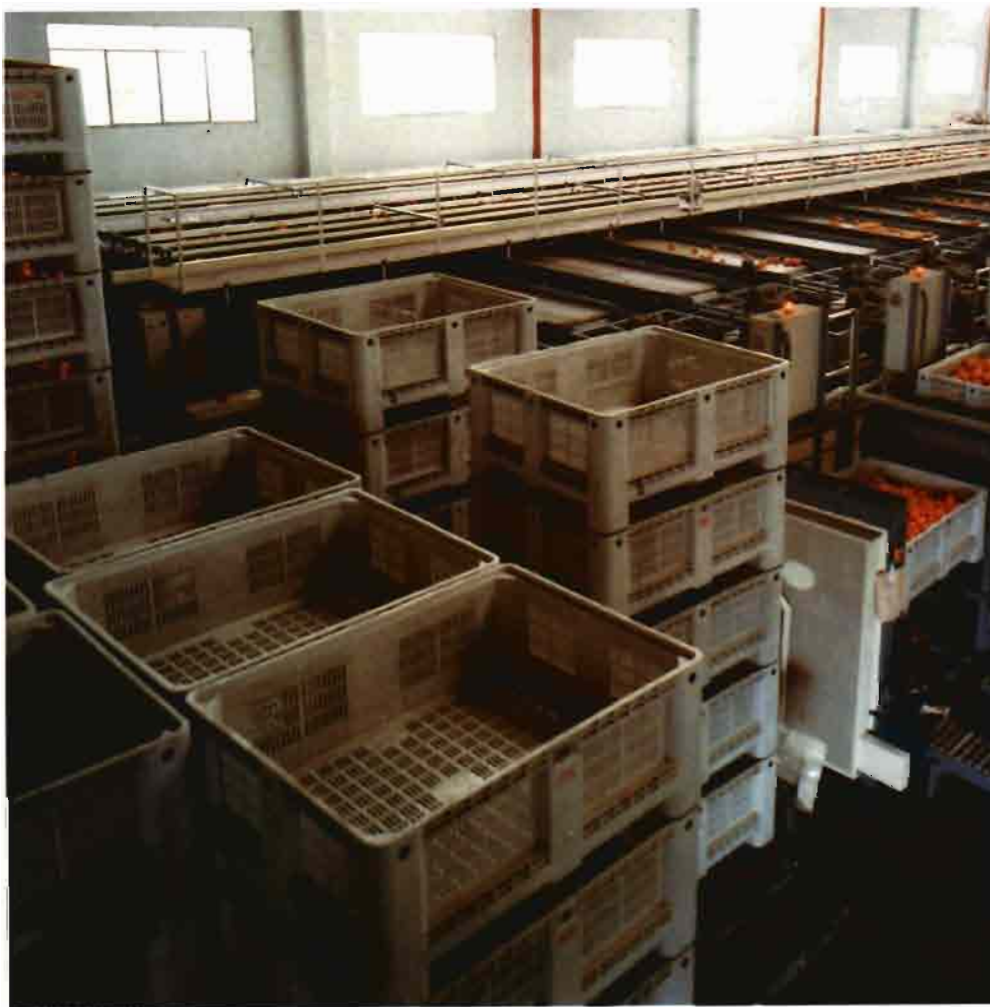
La velocidad de trabajo de la línea es común que se adecue a la condición de los frutos y al tipo de confección con encajado (menor velocidad que con enmallado)

No es frecuente que existan instrucciones por escrito para los transportistas en cuanto a la temperatura de transporte, la ubicación de la mercancía