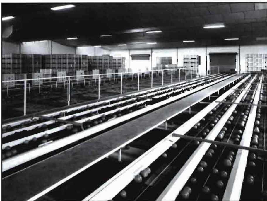
Naranjas en la línea de confección de un almacén.

7. El trabajo de selección es controlado por el encargado de cada confección, si existe, y/o por el jefe del almacén por observación visual no sistemática a lo largo de la jornada de trabajo. Este control podría mejorarse realizando un pequeño muestreo representativo, de 50 frutos por ejemplo cada 15-30 minutos de cada mesa de tría o de cada confección, y evaluando mediante un sistema rápido lo que permitiría corregir errores a tiempo, manteniendo una comunicación estrecha con el personal. Se debe recordar que, como bien señala Sánchez, 1991, «no hay en principio malos operarios, hay instrucciones mal dadas y sobre todo deficiencias