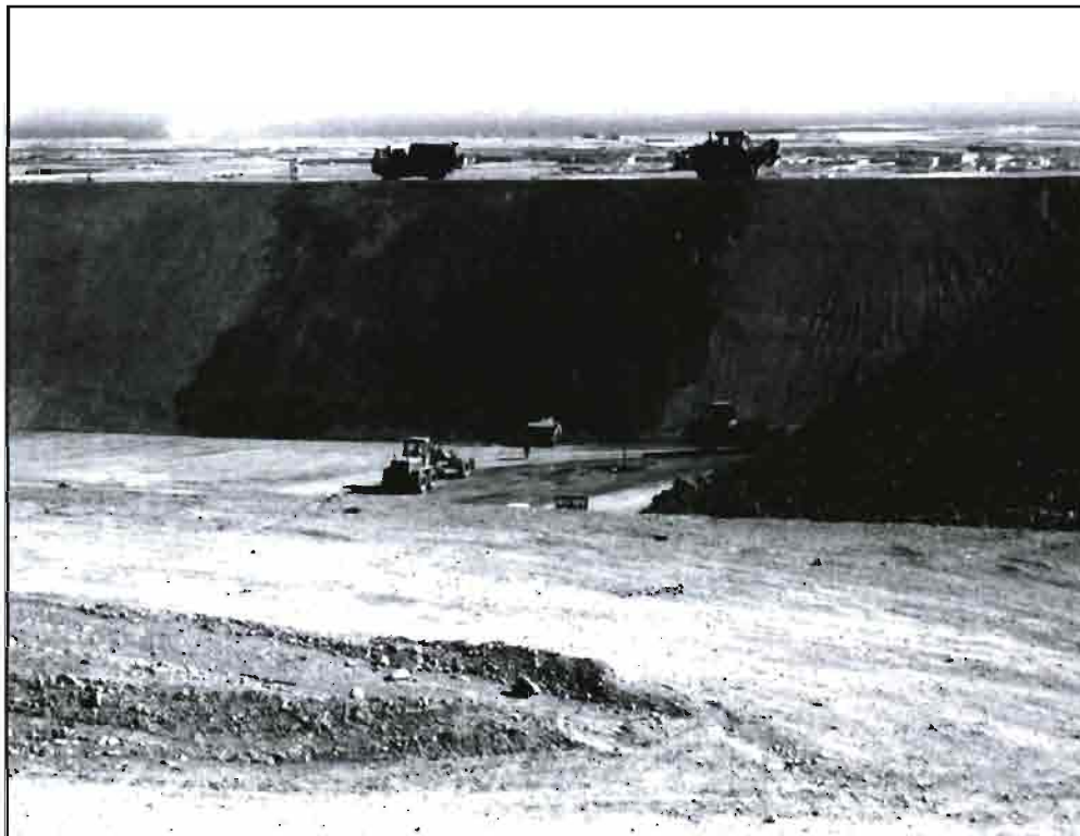
Vista de una de las balsas construidas para la Comunidad de Regantes «Sol y Arena» por la empresa Tecniriego, S.A.

en las «I Jornadas Nacionales de Cultivos Protegidos» organizadas por el Colegio Oficial de Ingenieros Técnicos y Peritos Agrícolas de Almería en Mayo de 1986: «Hace ya medio siglo, iba yo una mañana por la carretera de la costa, cuando al llegar a Balanegra - allí donde el término de Berja se asoma al litoral - me encontré con una escena, para mí, insólita: un terreno «enarenado» con una plantación de tomates en líneas regulares de hoyos y, en medio del bancale, un muchacho con un borriquito y 4 cántaras en la aguadera que con una lata de tomate vacía (de 1/3 de litro, aproximadamente) que le servía de medida, iba regando las matas una a una; verdadero trabajo de artesanía y primicia de riego localizado que, si años más tarde se haría con el perfeccionado sistema de «gota a gota», entonces se verificaba, sencillamente, con el «lata a lata».