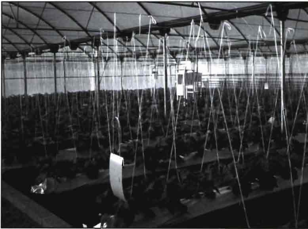
Ensayo relacionado con la fertirrigación en el C.I.F.A. de Almería.

El 5 de octubre de 1995, el Príncipe Felipe presidió una sesión del Tribunal, ataviado con el tradicional blusón negro utilizado por los labradores de la huerta valenciana, impuesto momentos