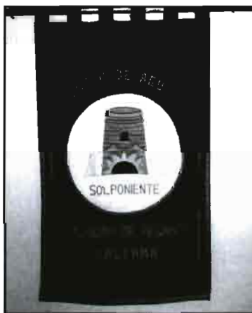
La Comunidad de Regantes «Solponiente» de Almería constituyó en 1988 el segundo tribunal de las aguas de España.

Con la finalidad de aprovechar mejor el aporte de fertilizantes a las plantas y evitar los problemas producidos por la emisión al suelo del exceso de algunos de ellos, el Área de Tecnología de la Producción y Fisiología del Departamento de Horticultura del Centro de Investigación y Formación Agraria (C.I.F.A.) Almería, antiguo Centro de Investigación y Desarrollo Hortícola (C.I.D.H.) La Mojonera - La Cañada, trabaja actualmente en tres temas relacionados