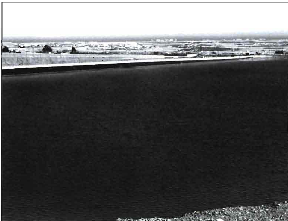
La misma balsa de la página anterior una vez construida.

Regulado por Decreto 96/1.990 de 13 de Mayo (BOJA Nº 26) se declaró de Interés General de la Comunidad Autónoma, conforme a lo dispuesto en el apartado 2 párrafo d) del art. 4 de la Ley de Reforma Agraria y en el apartado 2 párrafo d) del art. 77 de su reglamento, las actuaciones de reforma agraria en la comarca del Poniente en la provincia de Almería. El artículo 3 del mismo Decreto dispone la elaboración del Plan de Transformación conforme a lo establecido en el capítulo IV del Título 2 del Reglamento de la ley de Reforma Agraria.