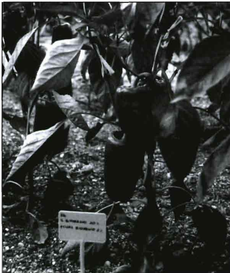
Ensayo del bioestimulante «Biorenal» en cultivo de pimiento.

La citada Junta, de acuerdo con sus Estatutos aprobados por resolución de la Presidencia de la Confederación Hidrográfica