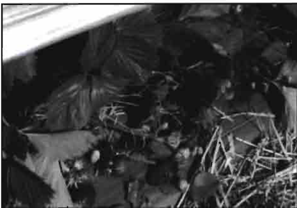
Cultivo de fresón acolchado con plástico azul, que disminuye el riesgo de quemadura de los frutos.

- los films transparentes aumentan considerablemente la temperatura del suelo durante el