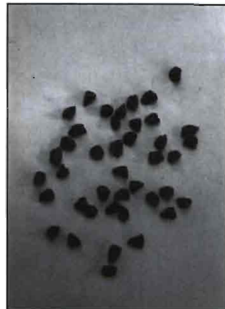
Arriba, un detalle de las semillas de maíz dulce. A la derecha, una cesta de maíz dulce recogido en el ensayo de la Masía Nova.

semiprecoces (ciclo superior a los 85 días). Aunque esta clasificación sólo corresponde a las siembras tempranas y en condiciones óptimas de cultivo, puede ser de ayuda a la hora de programar este último.