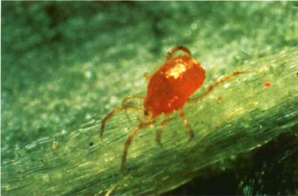
Se utilizó Phytoseiulus permisilis para combatir la araña roja, pero no tuvo tiempo de adaptarse ni de reproducirse, por lo que se utilizó otro tratamiento a base de Hexitiazox y ácido fosfórico.

ta para completar la parasitación de todo el ciclo fisiológico de la Lyriomyza . La suelta de Phytoseiulus se realizó después de ver que la población de araña roja iba aumentando, debido a la sensibilidad de este depredador a las altas temperaturas, la eficacia de éste disminuyó, no viéndose los resultados del todo satisfactorios, decidiéndose entonces por hacer un tratamiento con Hexitiazox . Se observó que este producto no dañaba la fauna de los enemigos naturales, y se comprobó que la actuación conjunta del producto y del depredador fueron suficiente para controlar la población de araña roja.