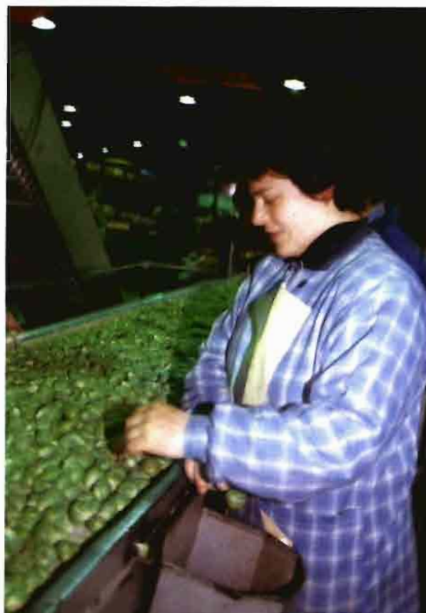
La tria es una de las operaciones que continua realizándose casi totalmente de forma manual.

Cada una de los frutas o piezas individuales que componen los envíos ha sido limpiada, seleccionada y calibrada y, muchas veces, también encerada.