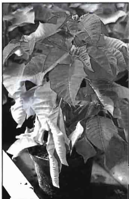
Enrollamiento característico hacia arriba de las hojas en una planta terminada con síntomas de Thielaviopsis basicola .

En el caso de un proceso incompleto de transformación de amonio a nitratos se acumulan nitritos, tóxicos para las raíces.