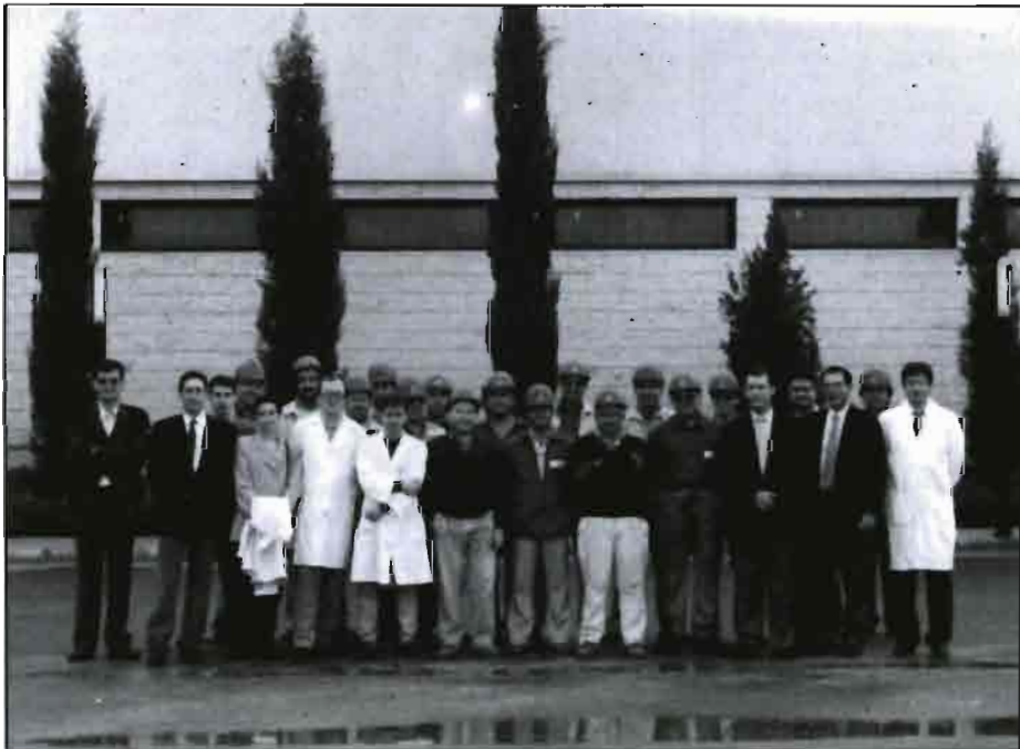
En la fotografía superior izquierda, las más recientes incorporaciones a la División Agro de Daymsa, incluido el camión. A la derecha, laboratorio de control de calidad de esta empresa.