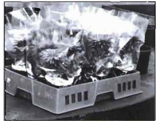
Embalajes especiales para plantas. En la fotografía de la izq., una bolsa especialmente diseñada para la comercialización de gerbera en maceta, y en la imagen superior otra planta en bolsa de film transparente perforado.

Para la próxima década se espera que el valor de las ventas de flor cortada y planta ornamental aumente en un 5-6% anual en todo el mundo. Un sistema de distribución eficiente es fundamental y preservar la calidad es el factor más importante.