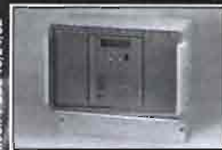
Mod.: T-SOL 16/24/32

T-SOL es un programador fiable y fácil de manejar tanto en su versión a pilas, como los equipados con panel solar.