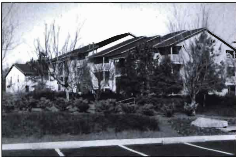
En la fotografía superior, el «mulching», utilizado en Xerojardinería para conservar el agua. En la fotografía inferior, Post Properties, en Atlanta. Una urbanización xerojardinada.