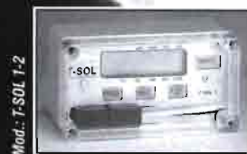
Mod.: T-SOL 1-2