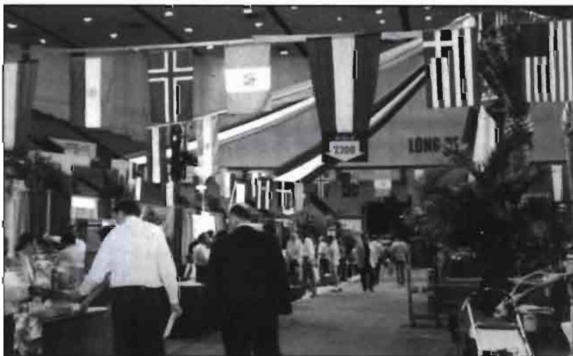
En las fotografías, las ferias comerciales «a la americana».

Cuando había surgido la idea «ya que estás en los Estados Unidos, por qué no escribes sobre la Horticultura americana?», parecía demasiado ambicioso: era un país demasiado grande. Hablar de todo un poco y de nada en concreto. Y ¿por qué no?, Le di la vuelta a la propuesta: ya que estaba en los Estados Unidos, pues, qué mejor oportunidad para conocer la Horticultura americana a fondo que tener que escribir sobre ella?