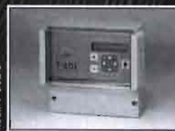
Mod.: T-SOL 8