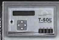
Mod.: T-SOL 4