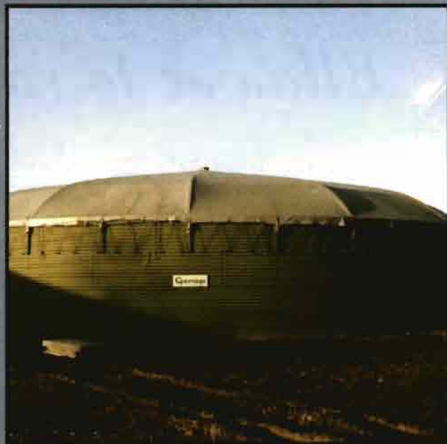
De 8.800 l (Ø 2,70 m) hasta 1.700.000 l (Ø 31 m) Para agua y para purines