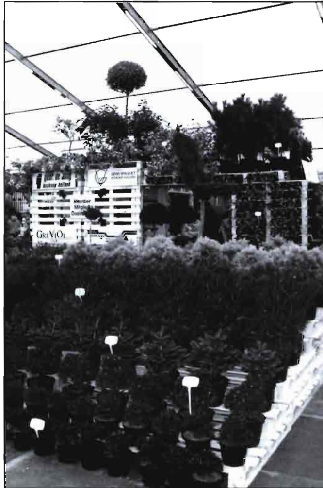
Estand de Plantarium en la última edición. Se ofrece al comprador una amplia gama de planta en maceta de alta calidad. (Foto: Archivo).

Otro de los atractivos del certamen son las actividades paralelas. Así, en 1991 cuando el certamen fue visitado por la redacción de Horticultura , el día de puertas abiertas coincidió con la visita a la Estación Experimental de Boskoop. Este día, que en realidad suelen ser dos, permite ver al público profano y profesional lo que se hace en estos centros o simplemente pasear por sus instalaciones. El llamado «Día Abierto» propone hacer un recorrido por las instalaciones del centro, en el transcur-