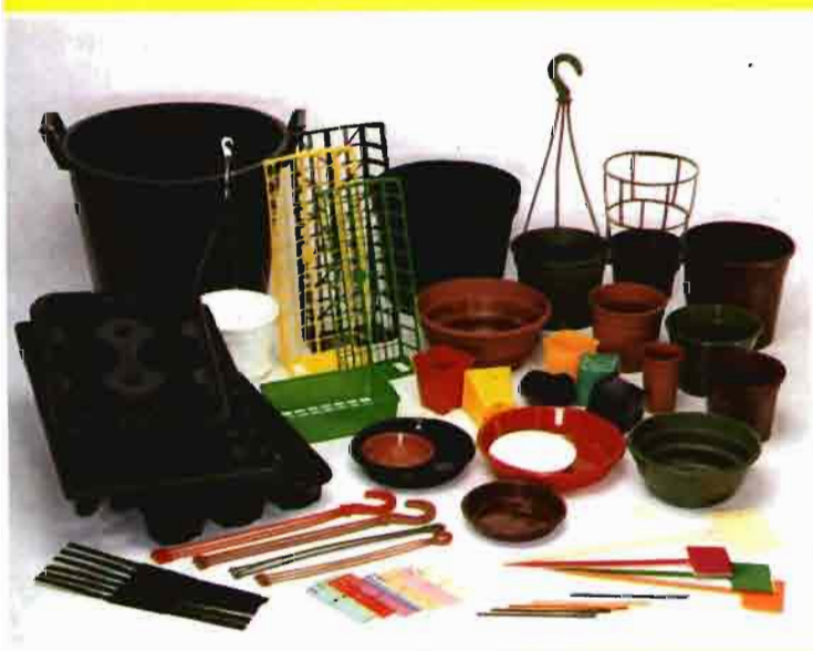
Vacetas, contenedores y otros artículos de plástico para la horticultura y los viveros

similares a donde se implantaron los ensayos, de textura franco-arenosa y con una capacidad de campo del 19.7%. Los riegos dados con posterioridad a que la plantación presentara un 20-30% de frutos maduros no aumentaron el rendimiento. Por el contrario, tuvieron efectos negativos, ya perjudicaron la agrupación de la maduración: el número de