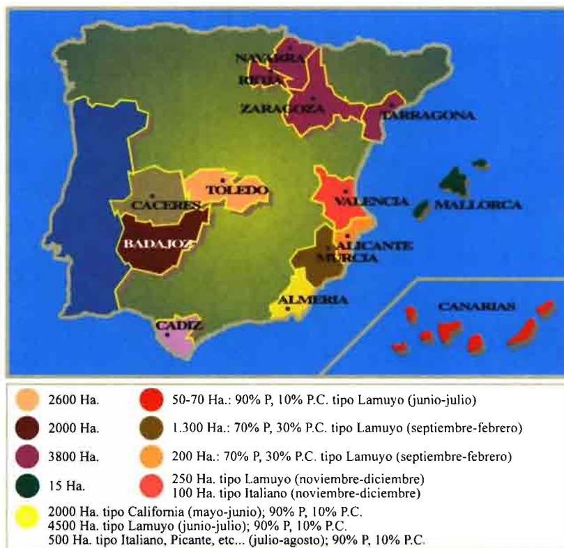
Figura 1: Superficie de cultivo de pimiento en España y calendario aproximado de siembra por tipos de pimiento.

P: Superficie en cultivo protegido / P.C.: Superficie al aire libre / Total superficie cultivada: 29.100 Ha. Entre paréntesis: fecha de siembra.