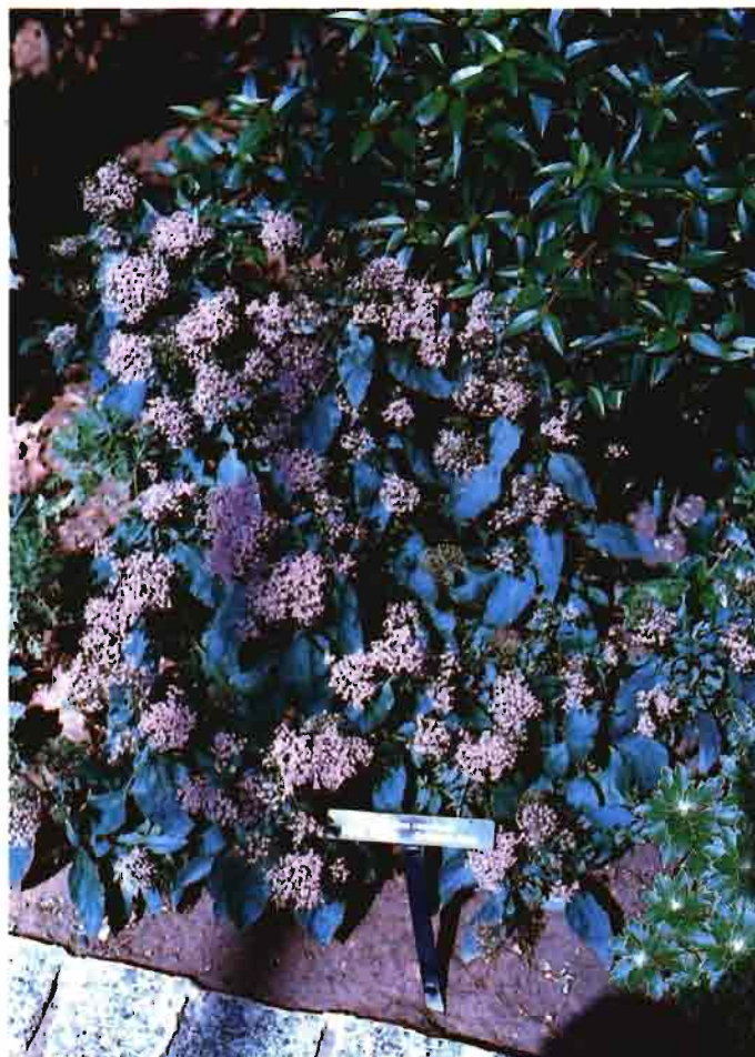
El Trachelium caeruleum ha sido introducido tanto para flor cortada como planta en maceta y planta de jardín.

La decisión de trabajar en una u otra especie viene condicionada cada