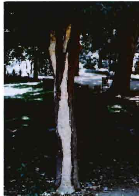
Arriba, restauración de un naranjo amargo. Al lado, poda de palmeras. Ambos trabajos están realizados por alumnos del curso.