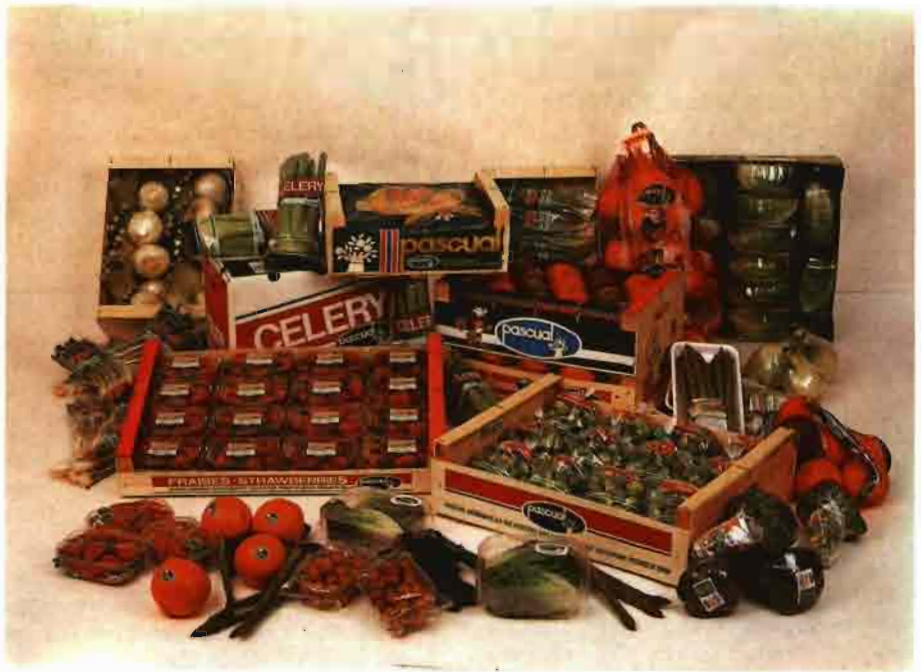
Embalajes de madera, cartón o plástico acompañados de una cierta estética y buena presencia como valor añadido del producto, se han convertido en una cuestión de marketing y publicidad para vender bien a través de la envoltura externa.

De estos diez requisitos son básicos los cinco primeros en relación con el mantenimiento de la calidad del producto, y se habla de mantenimiento porque el envasado no mejora esta calidad, debiendo, por tanto, envasarse únicamente productos de la mejor calidad. La inclusión de frutos podridos o dañados en los enva-