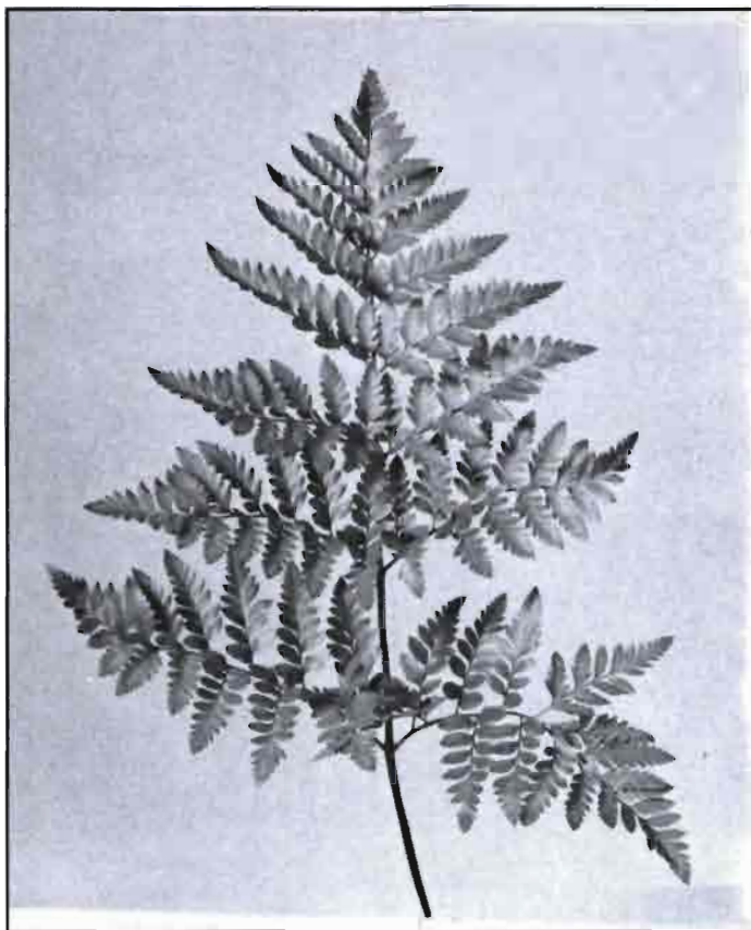
Hoja de Helecho de cuero.

Las primeras plantaciones de A. Microcladio en nuestro país, recién en los últimos 2 años, se hicieron en base al modelo israelí, en banqueta de 100 cm dos filas de plantación, separación de plantas en la fila de 30 cm, y una densidad por metro cuadrado de banqueta equivalente a 6 plantas. Al verificarse con esta densidad una cobertura muy lenta del espacio de cultivo, se planteó, timidamente, el añadir una fila central, llegándose así a 9 plantas. Sin embargo, en los Estados Unidos, en Florida, se está plantando sobre una densidad de hasta 60 plantas en banquetas de 1,20-1,50 m, y en Holanda, recomiendan densidades de plantación de hasta 80 plantas/m 2 de banqueta. Estos planteamientos de alta densidad, se basan en el concepto de llegar a una cobertura del bancal muy rápida, con una producción por metro cuadrado ya bien elevada en los primeros años, y en la práctica de arrancar posteriormente plantas para trasplantarlas. En base a nuestra experiencia, y con el objetivo de conseguir un punto de equilibrio entre la fuerte inversión en planta y la rápida productividad por metro, es que últimamente estamos planteando a nuestros agricultores la plantación con densidades entre 15-25 plantas/m 2 de banqueta de 1,20 cm.