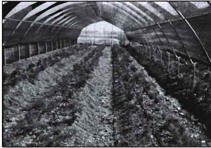
Plantación a 2 líneas bajo malla de sombreo de Asparagus microcladio .

No se han podido identificar estas manifestaciones a carencias nutricionales específicas, como tampoco a enfermedades o plagas. Se asocian probablemente a desarreglos fisiológicos, y con especial relación a la falta de humedad relativa dentro del umbráculo. Se ha podido minimizar esta manifestación, cuando la humedad relativa era especialmente baja,