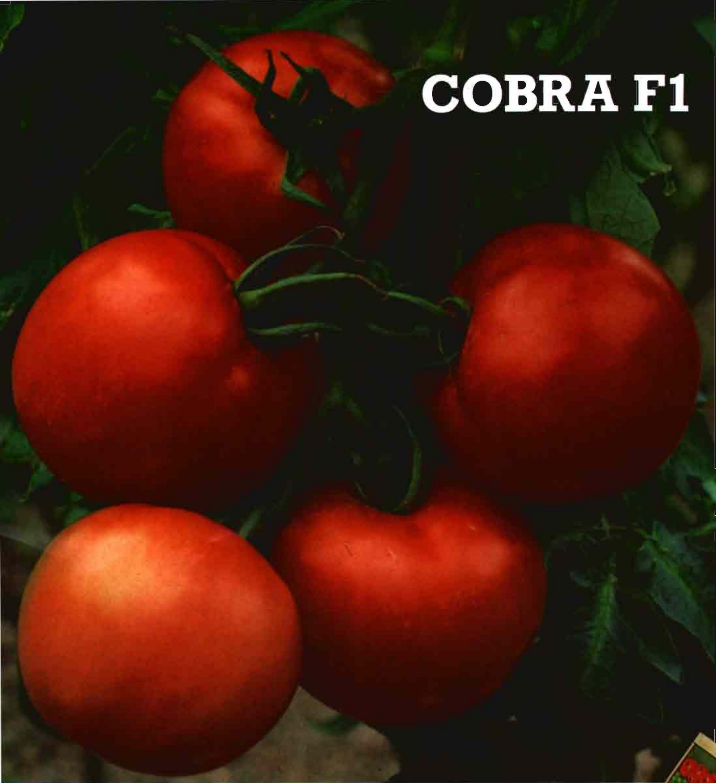
Illustration HORTICOLOR © LYON / Reproducción, misma perenne, entendié