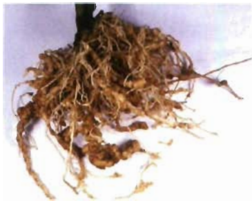
Daños de Meloidogyne spp en las raíces de un patrón resistente.

Plantación de pimiento en invernadero con «seca» o «tristeza» producida por Phytophthora capsici .