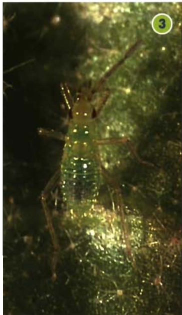
Foto 3. Ninfa de tercer estadio donde se observan los esbozos alares.

En el cultivo de tomate se han observado daños en forma de anillos necrosados alrededor de los tallos, pecíolos y botones florales. Los hábitos alimenticios de