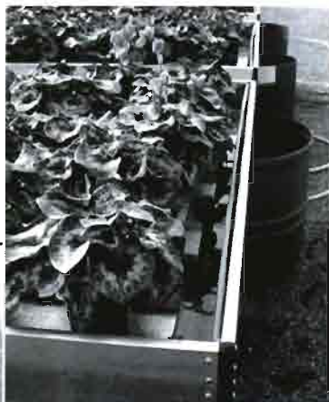
A la izquierda, versatilidad del sistema de riego por canalón: utilización en semillero de pimiento en lana de roca. Abajo, detalle del sistema de recogida de la solución sobrante en riego por canalón