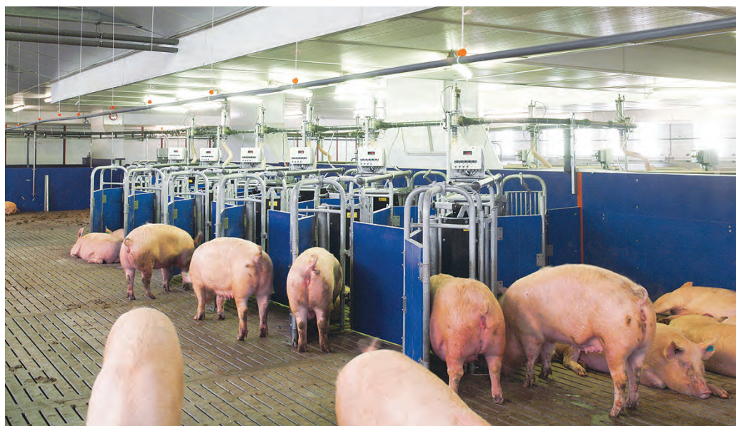
Cerdas gestantes en grupo con sistema electrónico de alimentación.

Los transpondedores se pueden colocar en porcino tanto en el exterior como en el interior del animal, en función de las necesidades prácticas y los costos. Así por un lado, si se quiere disponer de un transpondedor exterior, lo más utilizado son los crotales o marcas auriculares. En ese caso el transpondedor va protegido por un material plástico y se aplican de forma semejante a los crotales convencionales (Figuras 3A y 3C). Por otro lado, si lo que se desea es un transpondedor interior, en el caso del porcino se necesita inyectarlo bajo la piel del animal o en el interior de la cavidad abdominal mediante una metodolo-