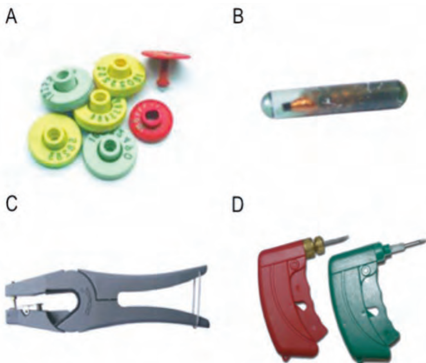
FIGURA 3 / Sistemas de identificación electrónica para porcino. A: Crotal electrónico; B: Transpondedor inyectable; C: Aplicador para crotales; D: Aplicador para transpondedores inyectables (Grassi et al 2012)