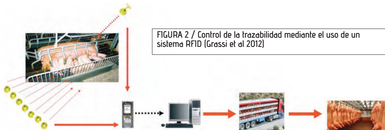
FIGURA 2 / Control de la trazabilidad mediante el uso de un sistema RFID (Grassi et al 2012)

nill et al 1996, Caja et al 1998, Caja et al 2000, Ribó et al 2001).