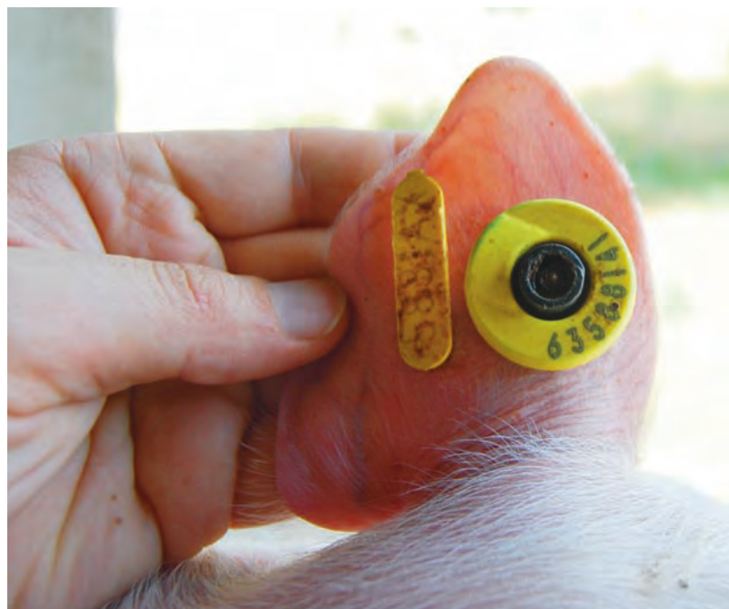
Cerdo de transición identificado con crotal electrónico HDX.

los porcinos (cerdas gestantes, cerdos de acabado...) y, por lo tanto, la obligación de alojar a los cerdos en grupos. Esta situación obliga a replantear los sistemas de trabajo y manejo de la información en las granjas porcinas, muchas de las cuales pueden encontrar nuevas estrategias de gestión mediante la utilización de sistemas e-ID