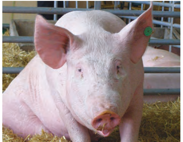
Cerdo de capa blanca

Los resultados obtenidos indicaron que los alcaloides del ergot se encontraron en el 52% del centeno destinado a alimentación animal, 95% de centeno para alimentación humana, 34% del trigo para alimentación animal, 86% de las muestras para trigo destinado a alimentación humana, 48% de triticale para alimentación animal y 76% de los productos alimenticios procedentes de las tiendas del total de las muestras. Los niveles de alcaloides se encontraban entre el 1 al 12340 µg/kg. Aunque las frecuencias de contaminación más altas se detectaron en las muestras de alimentación humana, las muestras para alimentación animal y en particular las de Suiza del centeno, contaron con los niveles más altos de alcaloides de ergot. Este proyecto presenta los resultados del CFP/EFSA/CONTAM/2010/01 "Estudio de los alcaloides del ergot en cereales destinados a consumo humano y alimentación animal" llevado a cabo de acuerdo con el artículo 36 del Reglamento (CE) nº 178/2002.