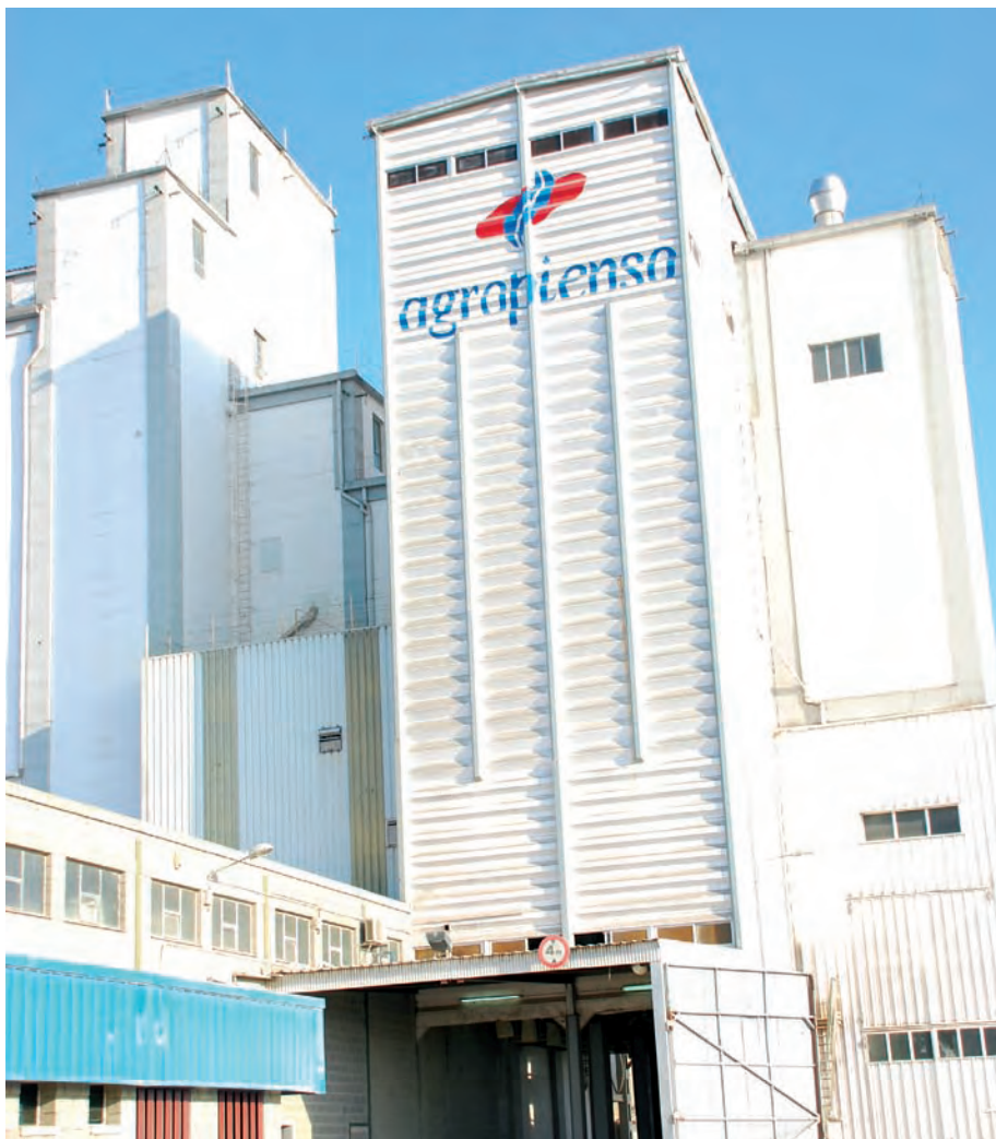
Fábrica de piensos en Binéfar, Huesca