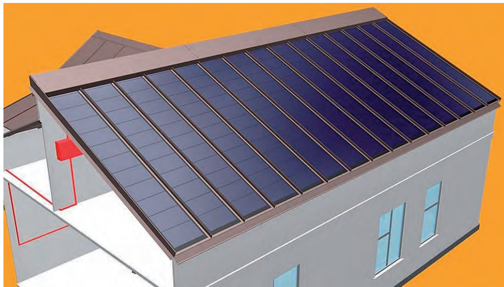
Panel de tejado con modulo fotovoltaico integrado

El actual marco jurídico 661/2007 y 1578/2008 obliga a las compañías eléctricas distribui-