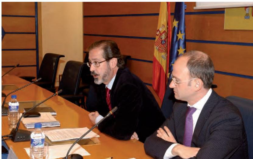
Francisco Mombiela, director general de Industria y Mercados Alimentarios del MARM, en la presentación del estudio

La carne de ovino representó en 2007 alrededor del 4% del total de carne comercializada (en kg de canal). El 59% se la lleva la del porcino, el 25% la de aves y el 11% la del vacuno.