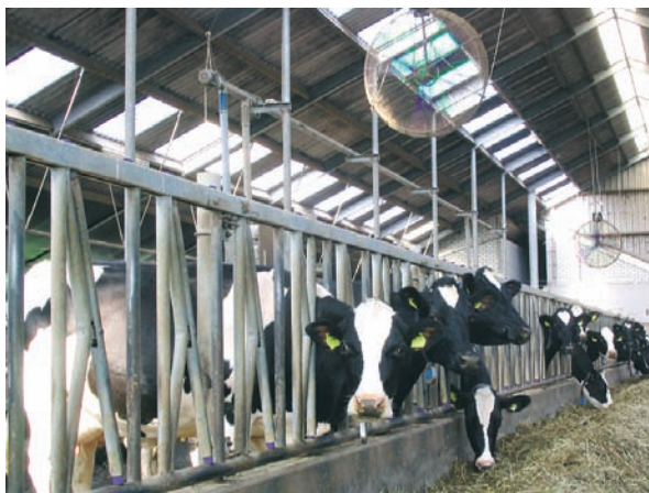
Detalle de la ventilación