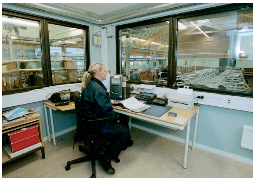
Sala de control

• Problemas de patas. El ordeño robotizado exige que los animales puedan moverse con facilidad ya que deben visitar la estación de ordeño entre dos y cuatro veces por día. Por lo tanto las vacas con problemas de