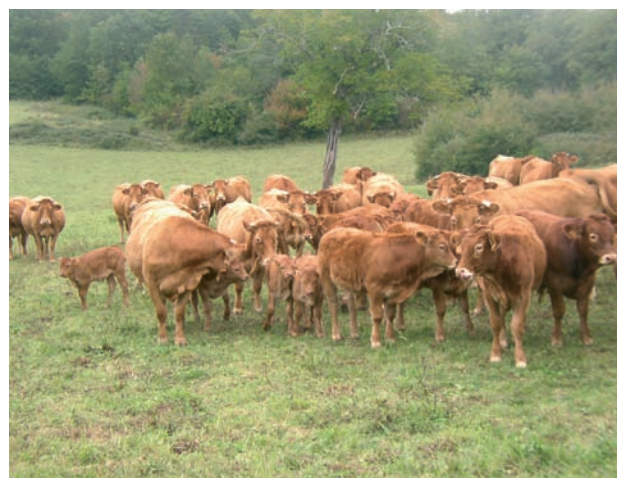
Rebaño de Limousin

La región de Limousin, también llamada "región de pastos", tiene fama internacional por su producción ganadera. Se encuentra en el noroeste del macizo central y posee un relieve muy acusado, pasando de los 150 metros en la zo-