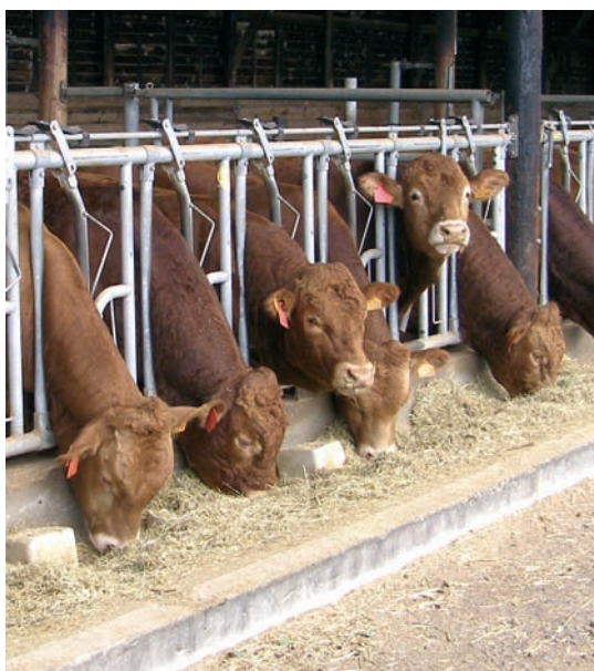
Ganado Limousin cebado en un centro de concentración

Se estima que la zona central del país quede, por su propia naturaleza, como una zona de producción de terneros similar al cebo que se realiza en España e Italia, aunque sin alcanzar las dimensiones de las explotaciones de dichos países.