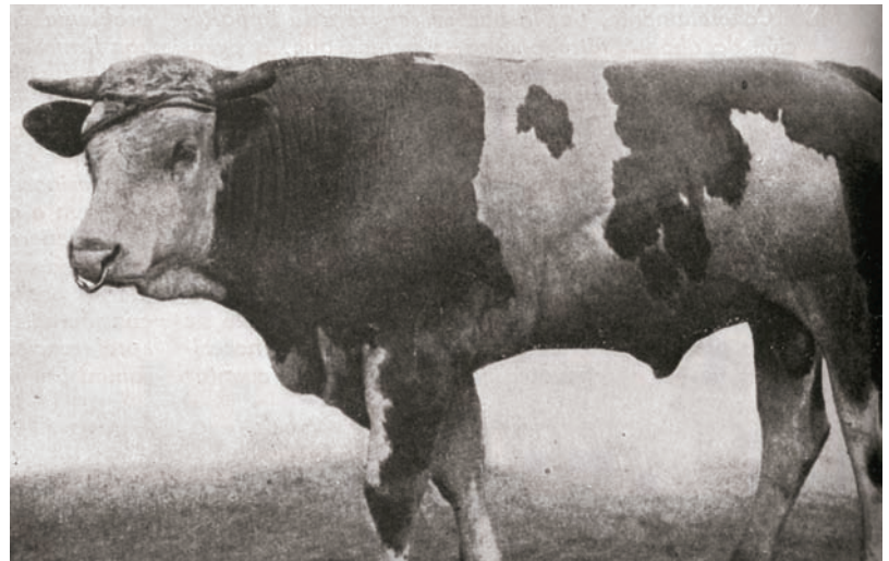
Raza suiza Simmental o del Jura, de gran desarrollo esquelético

La luz estimula también la formación del pigmento negro en los animales sometidos a fuerte insolación (caliente o fría), cuyos rayos ultravioletas, o de onda corta, queman la