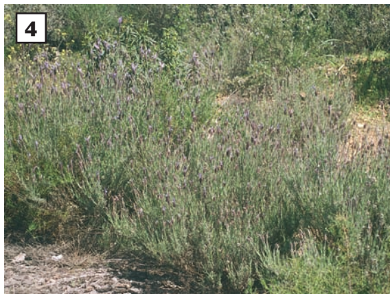
La investigación de plantas medicinales para su utilización en las nuevas terapias alternativas es básica en los programas sanitarios ecológicos. Cantueso. Finca Bienvenida. Paraje el Guindalejo. Abenojar. Ciudad Real. España. Autora: Carmen García-Romero Moreno.