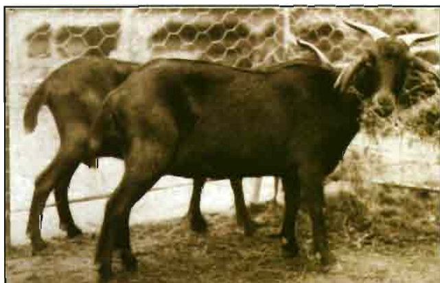
Cabras española de serranía

Desde que alguien anunció que la cabra es la vaca del pobre, ha venido dándose pequeños giros a la frase hasta llegar a decir que "la cabra es la vaca de los terrenos pobres", aserto que juzgo erróneo, como voy a procurar demostrar.