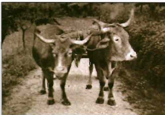
Pareja de bueyes de los alrededores de Pontevedra

La determinación del valor aproximado de esta ganadería es asunto más complejo que el aparentemente sencillo de contarla, del que se puede formar una idea muy vaga sabiendo que es un país de cría y recría; que los bueyes de trabajo se engordan para enviarlos al matadero de los cinco a los ocho