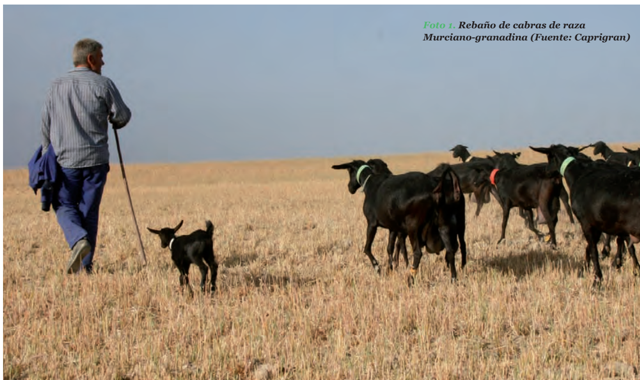
Foto 1. Rebaño de cabras de raza Murciano-granadina

Andalucía es la principal región española en producción caprina, con un total de 1.131.593 efectivos repartidos en 7.628 explotaciones, lo que representa el 39% del censo caprino español. La orientación productiva de los rebaños es predominantemente lechera, produciéndose alrededor de 250 millones de litros de leche al año, lo que supone el 48% de la producción de leche de cabra de España (MARM, 2007). Esta región cuenta con cuatro razas autóctonas especializadas en la producción de leche: Murciano-granadina, Malagueña, Florida y Payoya, aunque muchas explotaciones no tienen animales puros, sino cruces entre las mismas ( Foto 1 ). A pesar de que tradicionalmente el ganado caprino ha estado ligado al pastoreo en zonas de sierra, actualmente este tipo de ganadería se ha tecnificado e intensificado, aumentando la producción de leche, con altos niveles de grasa y proteína. Ade-