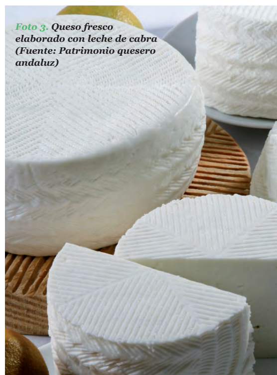
Foto 3. Queso fresco elaborado con leche de cabra

to 3 ). La comercialización de estos quesos se realiza principalmente a nivel comarcal y provincial, siendo pequeña la parte que se distribuye fuera de Andalucía, y prácticamente nula la que se vende fuera de España ( Gráfico 2 ). Las épocas de mayor venta de quesos son el otoño y el invierno. La tendencia de la fabricación y comercialización de quesos de cabra por parte de las cooperativas es creciente, de hecho la mayoría de las cooperativas que actualmente elaboran quesos tienen previsto aumentar la gama de productos derivados de la leche de cabra (crema de queso, quesos lácteos y postres).