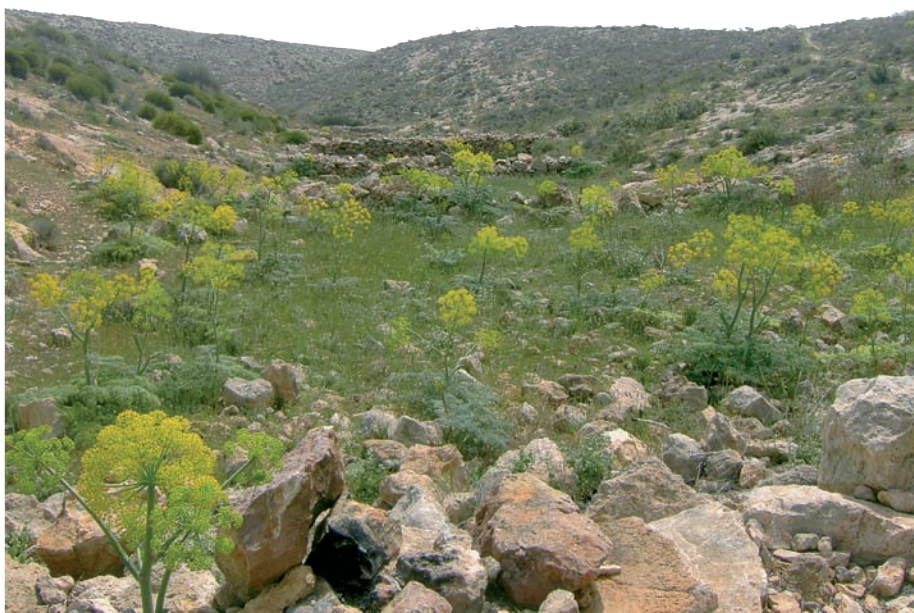
Entorno natural del Iberus

Este proyecto está apoyado financieramente por la Agencia de Innovación y Desarrollo de Andalucía, perteneciente a la Consejería de Innovación, Ciencia y Empresa de la Junta de Andalucía, como proyecto de Incentivos al Fomento de la Innovación y al Desarrollo Empresarial, con una duración estimada de tres años y cuenta con los permisos necesarios de la Consejería de Medio Ambiente para poder recolectar parentales de Iberus gualtierianus subsp. gualtierianus en su medio natural.