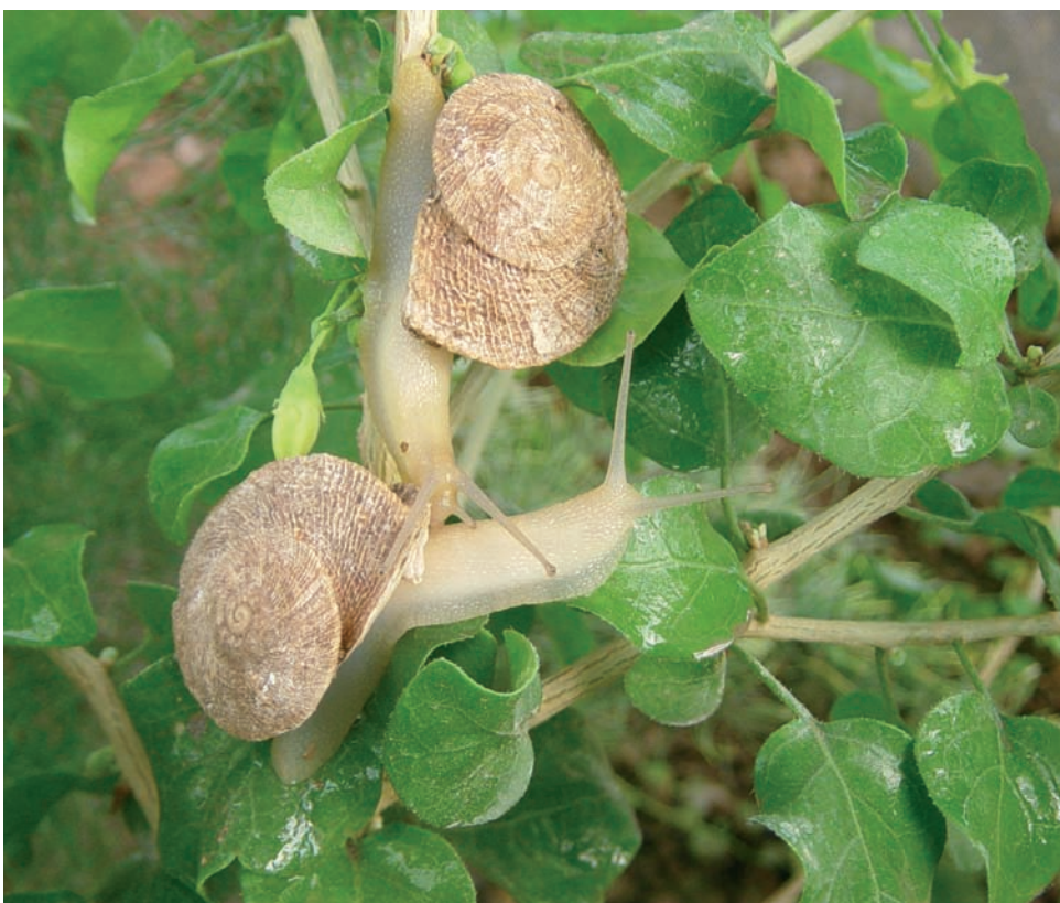
Ejemplares de Iberus

D urante generaciones el hombre ha vivido en estrecha relación con el medio que le rodea, obteniendo de éste los recursos necesarios para su supervivencia, desde los alimentos hasta las materias primas para la fabricación de útiles.