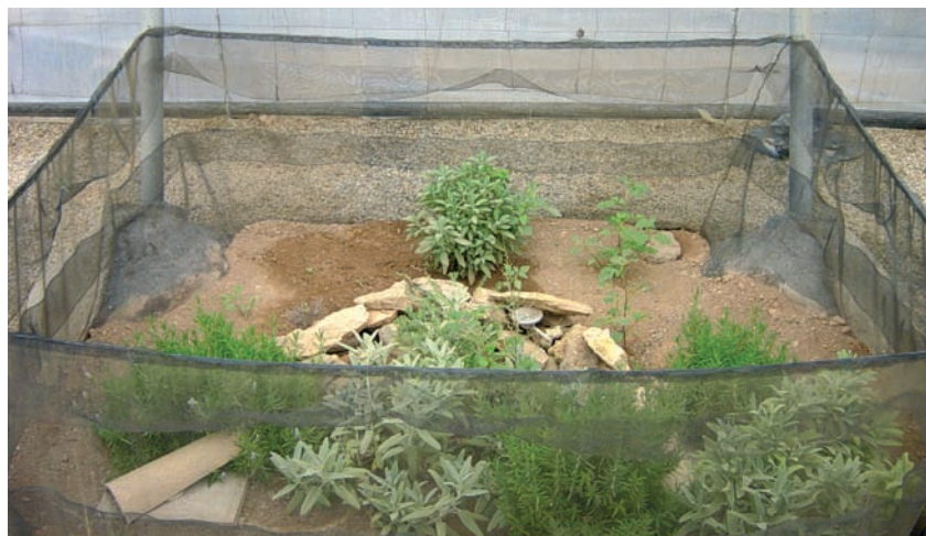
Parcela de ensayo

Para llevar a cabo la toma de datos, se ha optado por un modelo de distribución en parcelas. En cada una de estas parcelas hay entre 30 y 40 ejemplares de I. gualtierianus , en donde se van a realizar los ensayos sobre los parámetros ecológicos que inciden directamente en la supervivencia del animal (tipo de vegetación, sustrato, humedad, tipo de pienso) y los parámetros referidos a la optimización de la instalación de cría en cautividad (comparación de diferentes sistemas antifuga de las parcelas, malla antifuga y pastor eléctrico, colocación de malla de sombreado en el techo para disminuir la temperatura, etc.)