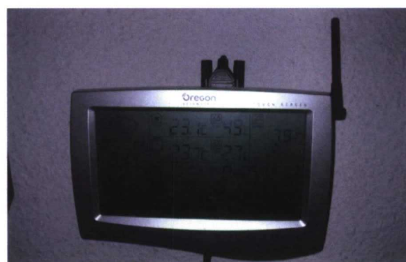
Consola central de la estación Oregon Scientific WMR928NX