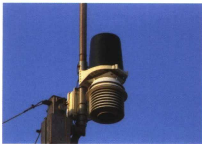
Conjunto de pluviómetro y abrigo con ventilación forzada de la Davis Vantage PRO. Es idéntico al del modelo PRO 2