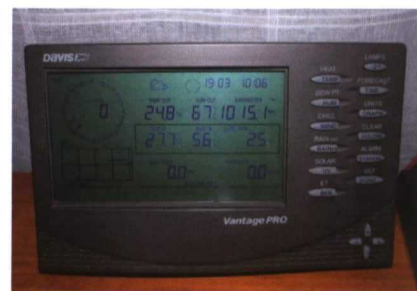
Consola de la estación Davis Vantage Pro, prácticamente idéntica a la PRO 2