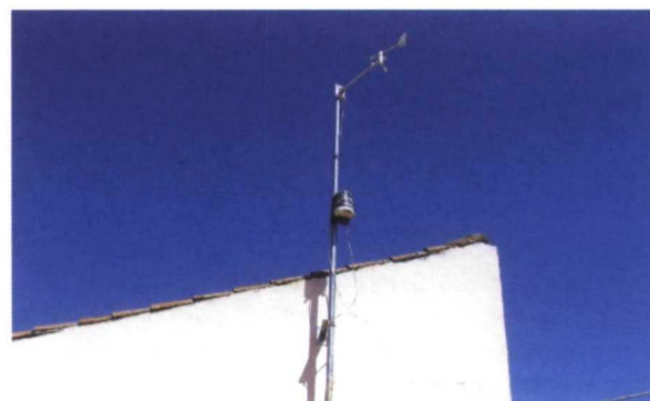
Estación meteorológica Oregon Scientific WMR928NX