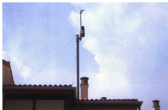
Conjunto de sensores (anemómetro/veleta, pluviómetro y sensores de humedad y temperatura) de la estación Davis Vantage PRO

Nuestra recomendación es optar por los modelos inalámbricos, porque no tener cables simplifica la instalación, aunque tendremos cuidado de no instalar los sensores demasiado lejos para evitar problemas de recepción de la señal.