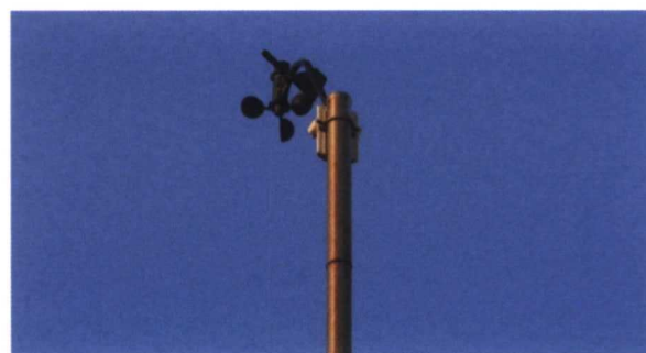
Anemómetro/veleta de la Davis Vantage PRO y PRO 2