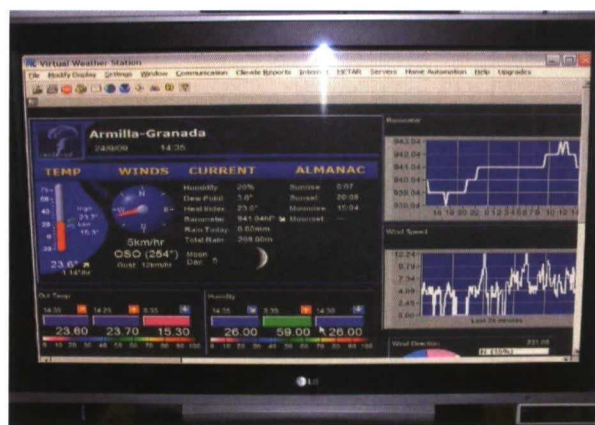
“Virtual Weather Station” programa informático de la estación meteorológica marca Oregon Scientific

► ..... Texto y fotografías: Pedro C. Fernández