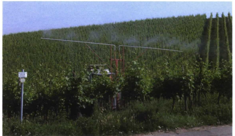
La biodinámica regenera la tierra empobrecida, por eso es tan solicitada en viticultura

cualquier caso, no lo suficientemente abiertos, pero creo que es posible practicar este método y lograr una verdadera producción agrícola. La cabeza en las estrellas, de acuerdo, pero los pies en la tierra con mucho realismo.