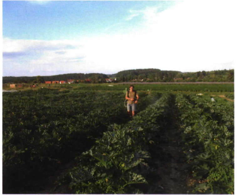
Aplicación manual de los preparados en la huerta

Es probable que los agricultores biodinámicos hayamos estado demasiado encerrados en nosotros mismos o, en