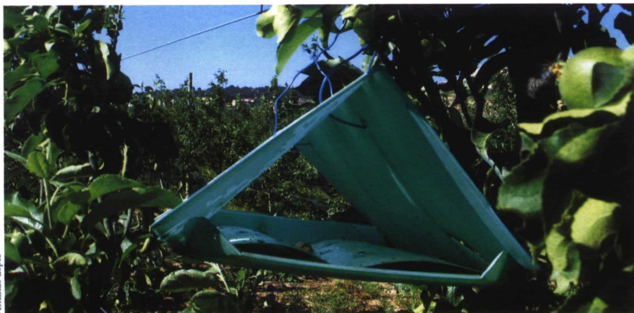
Trampa de monitoreo tipo delta

· Poner las redes (mejor blancas que negras) bastante pronto (en torno a mitades de abril) para impedir las primeras puestas.