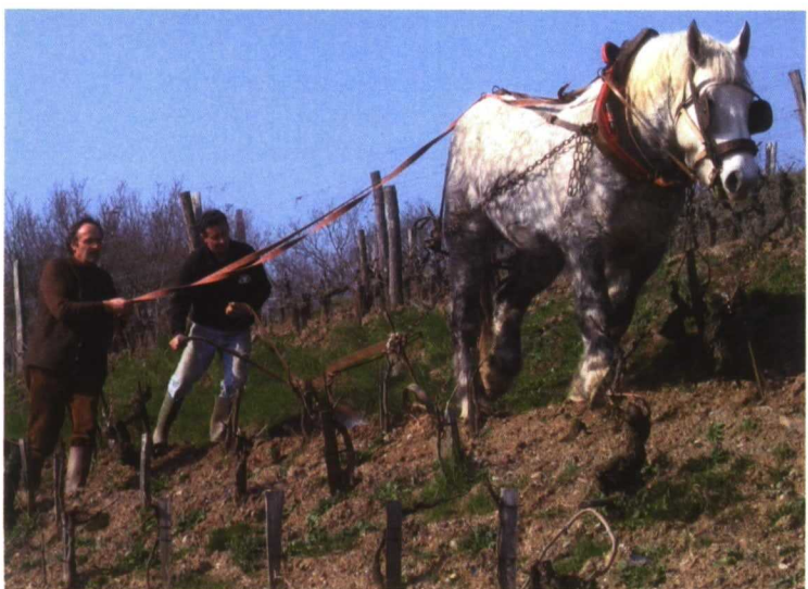
Viñedos de la familia Joly junto al Loira. Abajo, Nicolas guiando al caballo

nefastos efectos del CO 2 pero nunca de la inmensa polución energética que debilita cada día un poco más a la Tierra. Pienso en todas esas longitudes de ondas y frecuencias arbitrarias de las que el hombre satura cada día un poco más la atmósfera debido a los satélites, GPS, teléfonos móviles, trenes de alta velocidad, radares, etc. sin comprender las interferencias creadas por esas innumerables frecuencias y longitudes de onda, que van desde los ELF ( extra low frequencies ) hasta los gigahertzios de los portátiles (de 900 a 1.800 millones de vibraciones por segundo), sobre la matriz energética presente en la atmósfera y de la que recibimos cada segundo las fuerzas de vida. Es todo el organismo energético que da vida a la Tierra lo que se está destrozando. Todas esas armonías –los antiguos la llamaban música de las esferas– que dan forma a la materia y se vuelven a continuación planta, animal o seres humanos, parten de un sistema energético increíblemente activo, que sin cesar organiza, separa, fusiona los átomos para desembocar en la inmensa diversidad del mundo vivo que nos rodea. Finalmente, como dijo Max Plank premio Nobel de Física, todo ese plano físico, en su inmensa diversidad, no es más que una masa de átomos en agitación permanente, condensada por la gravedad terrestre. Estas agitaciones nosotros