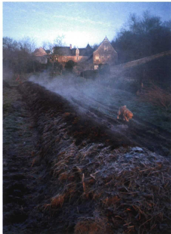
En la viña lo importante es la calidad del compost, con los preparados biodinámicos

Vayamos más lejos. Si la Tierra estuviera rodeada de un inmenso plástico negro toda la vida o casi toda, desaparecería. Hoy día por todas partes se nos habla de los