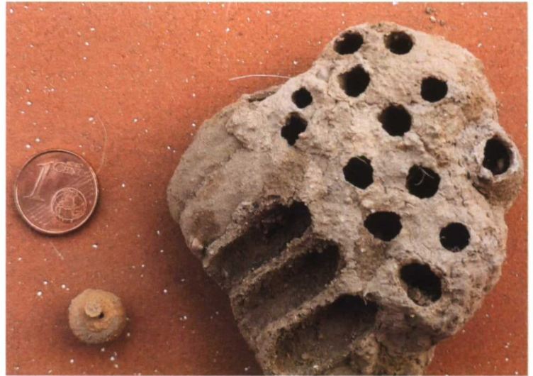
Comparación de tamaños entre el nido de una alfarera ( Eumenes sp.), una cazadora de arañas gigante ( Sceliphron sp) y una moneda de un céntimo

Para empezar, es necesario conservar zonas con vegetación rica en floración ya que los adultos se alimentan de néctar y polen. Esto, además de influir en su presencia, también lo hará en una mayor fecundidad de las hembras y por tanto en un mayor número de nidos. En el caso de no haber suficiente vegetación, crearemos zonas con vegetación adecuada, sea herbácea o arbustiva, utilizando especies de la zona que se adaptarán mejor, exigirán menos y darán más.