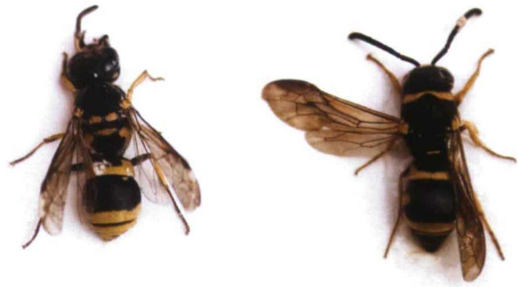
A la izquierda Ancistrocerus sp, una de las avispas albañiles más frecuentes. A la derecha, una mayor coloración de negro, el abdomen con forma de bombilla y el pequeño tamaño de apenas un centímetro nos indican que se trata de un Euménido. Odynerus ? sp.

Podemos encontrar, sobre todo en las construcciones humanas, nidos hechos con barro, formados por numerosas celdas alargadas y que suelen ser más grandes que una pelota de ping-pong. Se trata de la obra de una Sceliphron sp. de la familia Sphecidae. Es una avispa grande, de unos 2,5cm, delgada y alargada, de color negro y amarillo. Esta avispa abastece su nido con arañas, lo que podemos com-