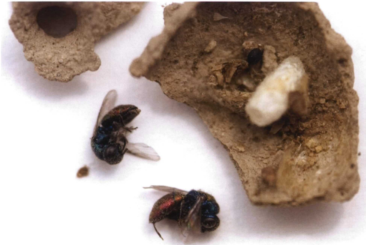
Dos pequeñas y brillantes avispias cuco ( Chrysis fulgida ), habían parasitado este nido

En el caso específico de las avispias albañiles, podemos aumentar los lugares idóneos para que realicen sus