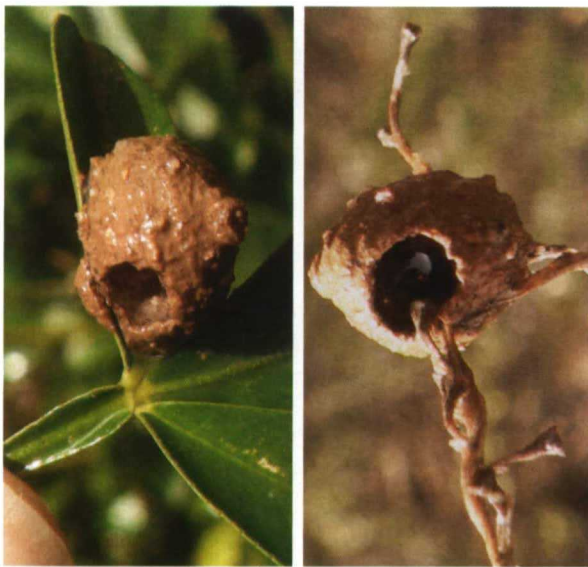
Localización poco frecuente de un nido en la hoja de un naranjo espinoso. Se aprecia agujero de salida. A la derecha nido construido sobre la cubierta seca

Algunos Euménidos realizan sus nidos únicamente con barro como uno de los géneros más frecuentes, Eumenes . Forman pequeñas ánforas cuya boca se estrecha y prolonga ligeramente, como un pequeño embudo. Tienen el tamaño aproximado de una moneda de un céntimo. Normalmente, una vez hecho el nido suelen buscar otro lugar para construir el próximo, aunque podemos encontrar varias anforitas juntas, pero hechas por la misma avispa y nunca formando un panal o enjambre. De esta forma se ahorran trabajo y barro, pues al hacer una junto a otra puede utilizarse la pared de la primera. A veces las alfareras economizan aún más los recursos. El género Odynerus , menos frecuente, forma una galería descen-