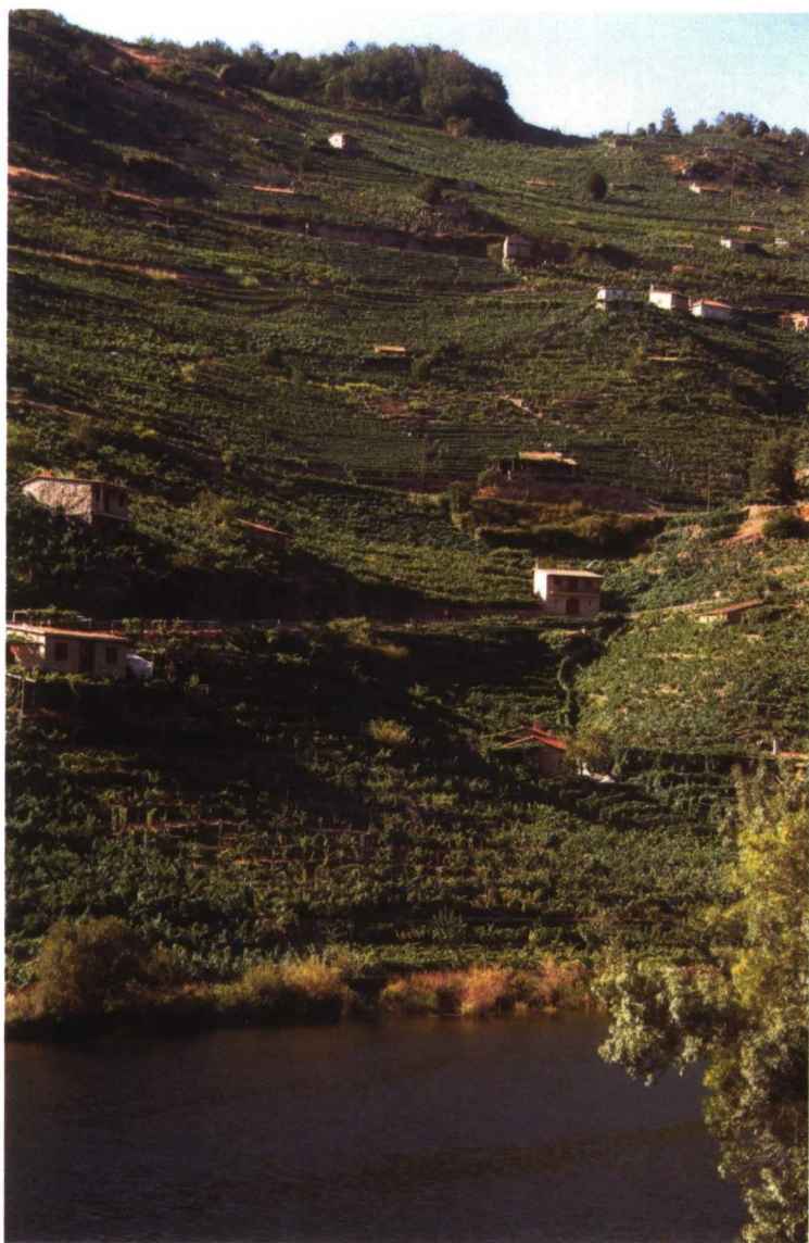
Las viñas, bodega y merendero están a orillas del Miño, en la parroquia de A Sariña, en plena Ribeira Sacra de Chantada (Lugo)