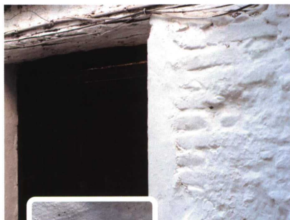
..... A la derecha de la puerta de esta caseta de huerto, un nido de avispa alfarera repleto de larvas de mariposa y de polilla

Sabemos que el aumento o restauración de la diversidad en el agroecosistema hace que aparezcan más especies be-