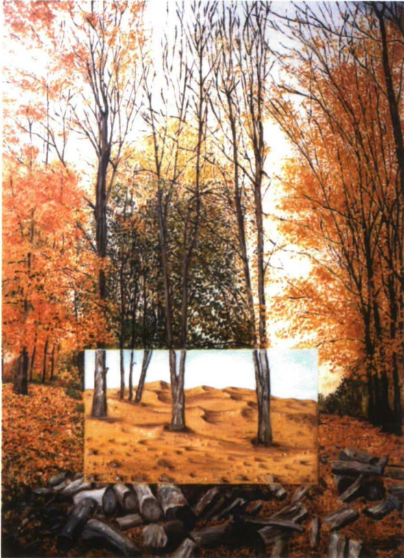
Si cada habitante del planeta consumiera tanto como los occidentales, haría falta el equivalente a tres planetas Tierra

Ayuntamiento para terminar con esa contaminación que me molesta, allí me responden que detendrán los tratamientos municipales pero que en cuanto a los tratamientos desde el helicóptero de los viticultores les es más difícil intervenir pues en el pueblo muchos electores son viticultores. Hasta ahí mi rebelión no concierne más que a un problema que me afecta directamente: mi reacción es bastante egoísta. Al prestar atención al problema de los pesticidas, me informé y me di cuenta de que Francia es el segundo país en utilización de pesticidas en el mundo. Tomé conciencia de la actuación de numerosas asociaciones que luchan contra los pesticidas y que sobre todo proponen alternativas. En efecto, es difícil limitarse a señalar sin proponer alternativas pertinentes.