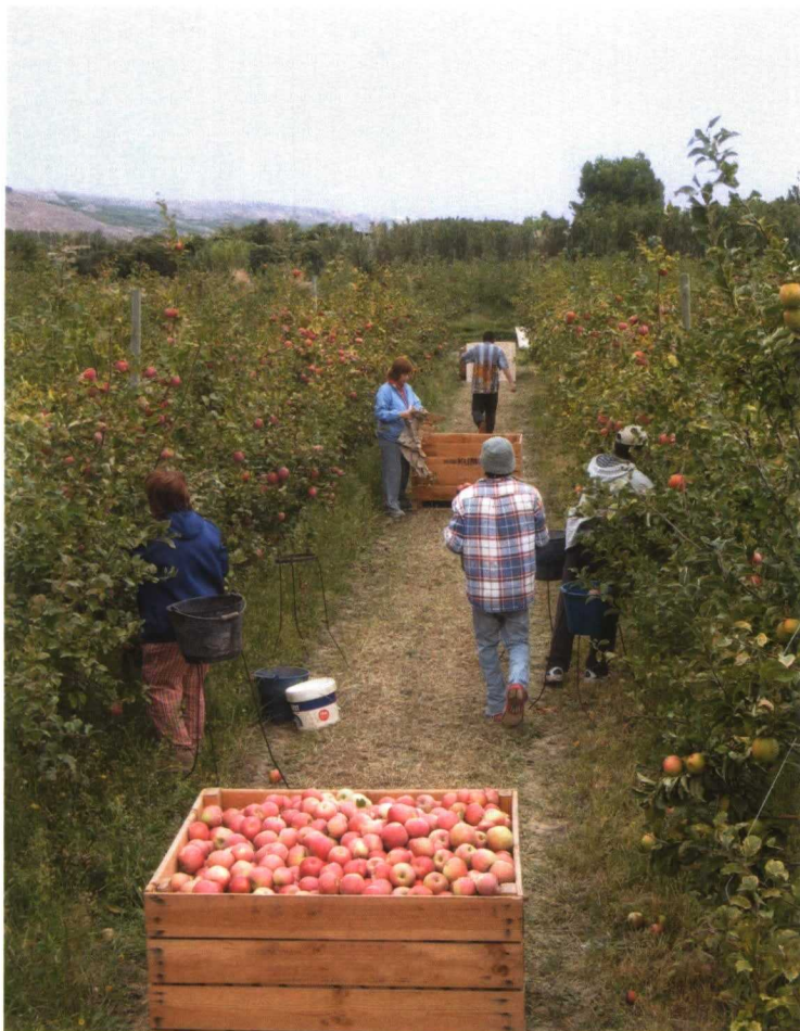
..... Desde el momento que amplí mi interés personal a los problemas de los otros me convierto en un actor de la "sociedad civil" despierta

dar a las plantas y animales a perseguir su evolución hacia la individualización, lo que se hace por ejemplo dando nombre a los animales domésticos, etc.; "educándolos" en el verdadero sentido de la palabra. (En francés élevage , ganadería, viene del verbo élever que significa criar y también elevar y educar).