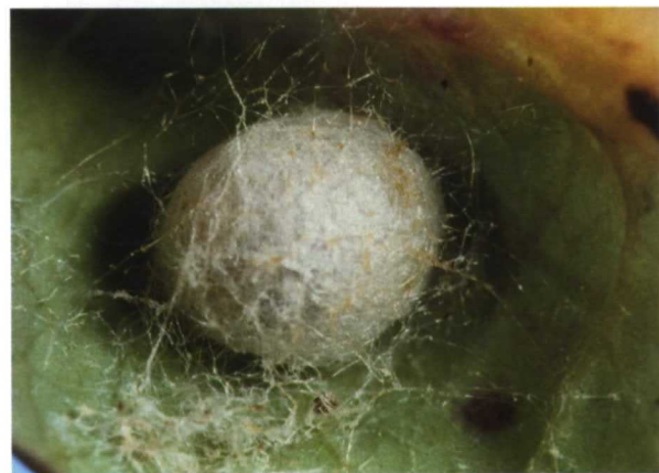
Capullo de donde saldrá adulta

que intentemos recrearlos a pequeña escala en nuestros espacios cultivados.