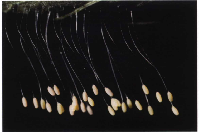
Huevos de crisopa colgando de su pedicelo

Cuanta más variedad, cuanta más biodiversidad, mejor para el equilibrio biológico. En cambio la supresión de setos y la invasión de las construcciones les van privando de su espacio vital. Muchos son destruidos o su desarrollo frenado a causa de los plaguicidas, por la contaminación etc. No hay que subestimar la importancia de las hierbas que continuamente intentamos suprimir y que también por una circunstancia u otra desaparecen del entorno no cultivado. Para compensarlo, cuidemos al menos de esas “isletas de salvación”, esos pequeños biotopos que constituyen los estanques, lagunas, setos, orillas de los bosques y riberas de los ríos, praderas, etc. Es importante también que estos espacios estén unidos o conectados entre sí lo más posible o